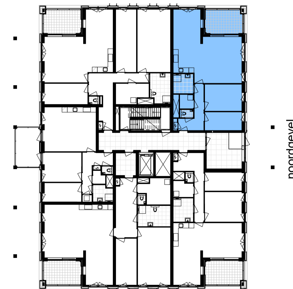
overzicht, 1e verdieping schaal 1 : 250