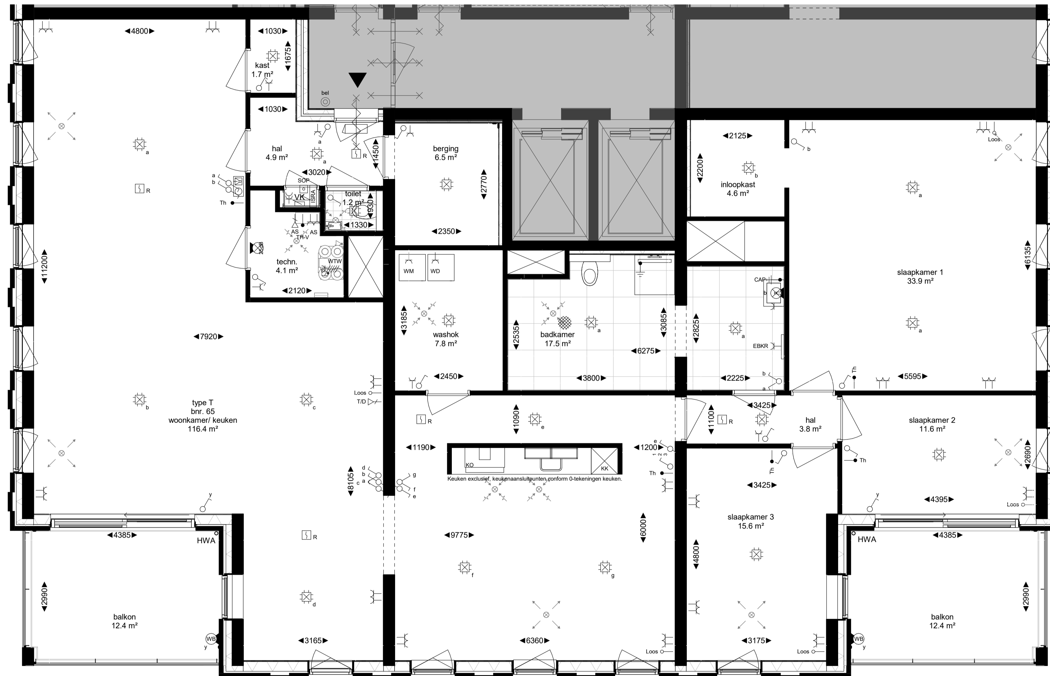
plattegrond, type T schaal 1 : 50