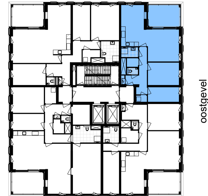
overzicht, 5e t/m 15e verdieping schaal 1 : 250