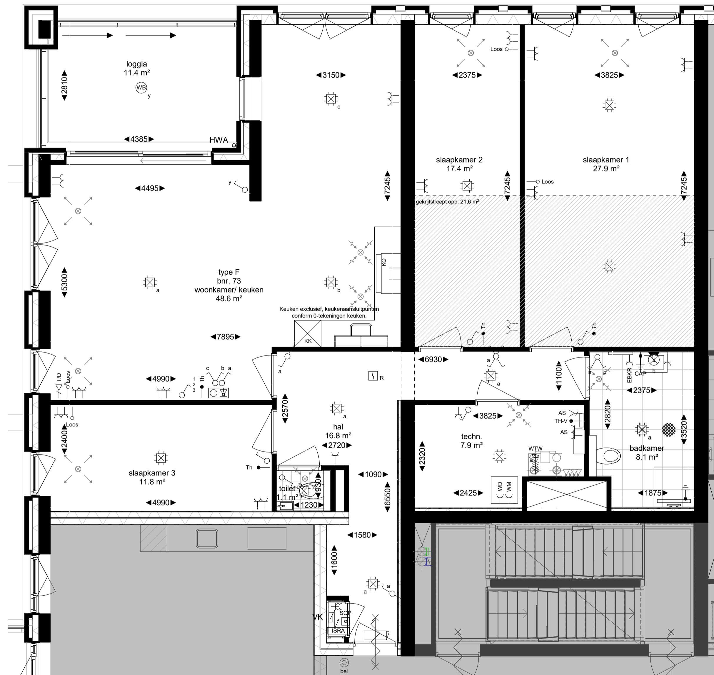
plattegrond, type F schaal 1 : 50