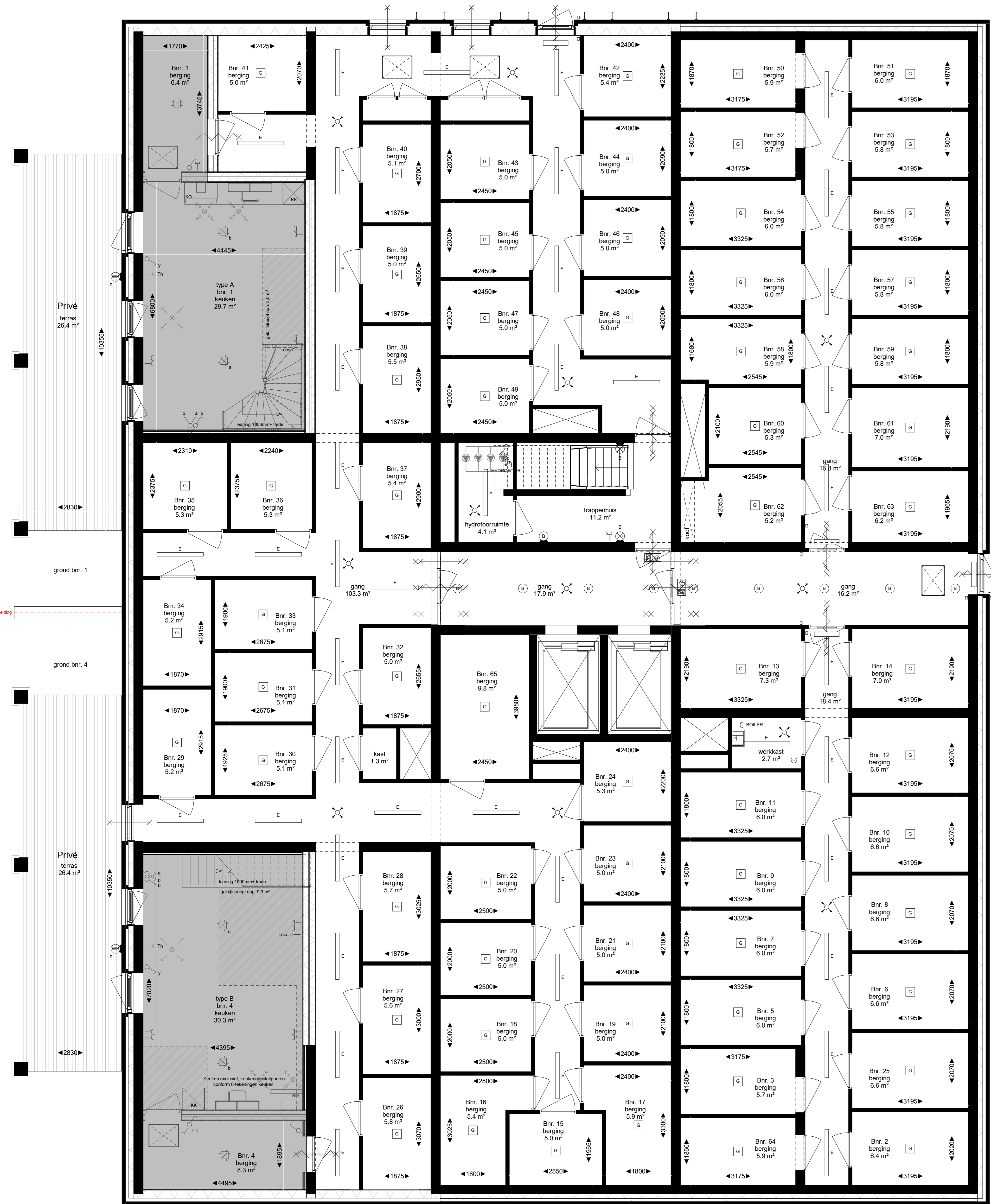
plattegrond, bergingen 'De Hoge' schaal 1 : 50